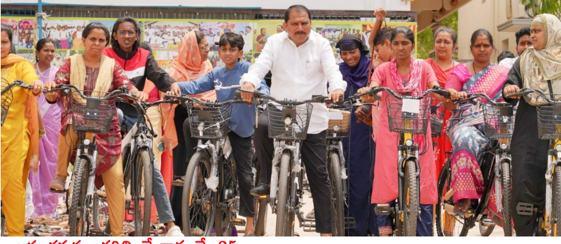
అనంతపురం, కదిలిచే వార్త, మే 25 :