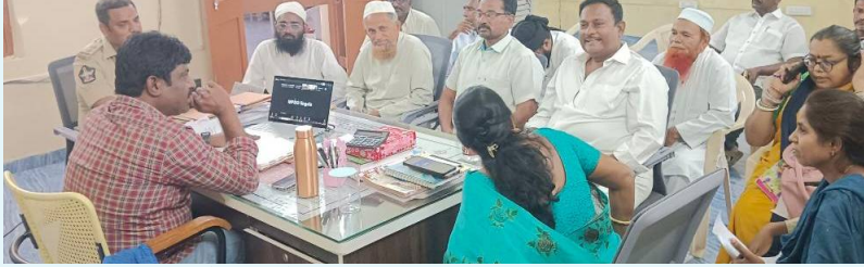
కమలాపురం కదిలిచే వార్త మే 25