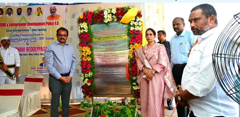
కడప మే 25 కదిలిచే వార్త

- 'ఫ్లాటెడ్ ఫ్యాక్టరీ కాంప్లెక్స్'కు శంకుస్థాపన.