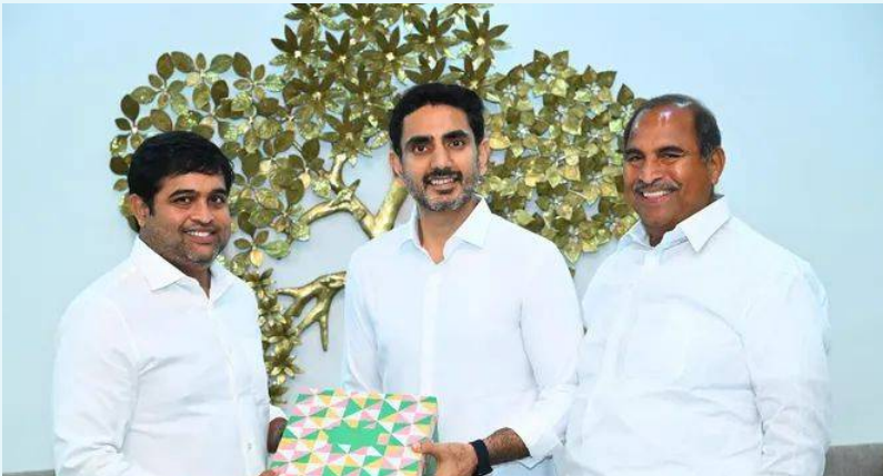
కమలాపురం కదిలిచే వార్త (మే 25)