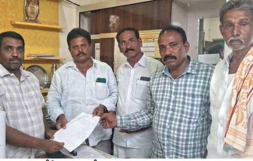
ప్రయత్నం చేస్తానని హామీ ఇచ్చారు.

ప్రస్తుతం రైతులకు ఉదయం 8 గంటల నుండి సాయంత్రం 5 గంటల వరకు విద్యుత్ సరఫరా అవుతున్నదని దీంతో వరి పైరు చేస్తే రైతులకు ఇబ్బందిగా మారందని ఎజి దృష్టికి తెచ్చారు. కాబట్టి రైతుల ఇబ్బందులు తొలగించేందుకు ఉదయం 6 గంటల నుండి సాయంత్రం 3 గంటల వరకు విద్యుత్ సరఫరా చేస్తే ఇబ్బందులు తొలిగి పోతాయని తెలిపారు కాబట్టి రైతుల ఇబ్బందులను దృష్టిలో పెట్టుకొని విద్యుత్ సరఫరా వేళలను మార్చాలని కోరారు. చక్రాయపేట మండలంలో కూడ వరి పంట సాగు చేసే రైతులకు విద్యుత్ సరఫరాలో వేళలు మార్చాలని తెలిపారు. దీంతో విద్యుత్ ఎజి కూడ స్పందించి రైతులకు ఇబ్బందులు లేకుండా చేసేందుకు