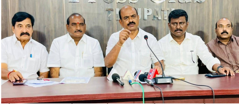
రైల్వే అభివృద్ధి పనులు చేపట్టాలన్నా లేదా ప్రకృతి వైపరీత్యాల సమయంలో సమస్యయందే చేయాలన్నా నలుగురు డివిజన్ డిరెక్టర్లతో మాట్లాడుతున్న రిజిస్ట్రార్ నెలకొన్నదన్నారు