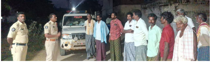
తిరుపతి క్రైమ్ కదిలిం చే వార్త 7 మే