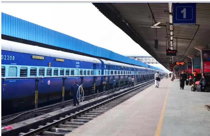
నగరాల గుండా ప్రయాణిస్తుంది.సికింద్రాబాద్ నుండి అనకాపల్లికి (రైలు నం. 17043);సికింద్రాబాద్ లో ఆదివారం రాత్రి 21:00 గంటలకు బయలుదేరుతుంది.గుంటూరుకు తెల్లవారుజామున 02:50 గంటలకు, విజయవాడకు 04:40 గంటలకు చేరుకుంటుంది. అలాగే రాజమండ్రికి ఉదయం 07:55 గంటలకు, చివరగా అనకాపల్లికి సోమవారం మధ్యాహ్నం 12:00 గంటలకు చేరుకుంటుంది.అనకాపల్లి నుండి సికింద్రాబాద్ కు (రైలు నం.17044);అనకాపల్లిలో సోమవారం సాయంత్రం 17:35 గంటలకు బయలుదేరుతుంది. రాజమండ్రికి రాత్రి 20:40 గంటలకు, విజయవాడకు అర్ధరాత్రి 00:40 గంటలకు చేరుకుంటుంది. సికింద్రాబాద్ కు మంగళవారం ఉదయం 08:40 గంటలకు చేరుకుంటుంది.ప్రధాన స్టాంపింగ్:చర్లపల్లి, నల్గొండ, గుంటూరు, విజయవాడ, గుడివాడ, కైకాల, ఆకివీరు, భీమవరం టౌన్, తణుకు, రాజమండ్రి, సామర్లకోట, అన్నవరం, తుని, ఎలమంచిలి.కోవ్వల వివరాలు:ఈ రైలులో ప్రయాణికుల సౌకర్యం కోసం వివిధ రకాల ఏసీ కోచ్ లు అందుబాటులో ఉన్నాయి. 1 -- ఫస్ట్ క్లాస్ ఏసీ (1A) 4 -- సెకండ్ ఏసీ (2A) 12 -- థర్డ్ ఏసీ (3A) కోచ్ లు ఉన్నాయి.ఈ సమర్పణ సీజన్ లో దక్షిణ మధ్య రైల్వే పలు ప్రాంతాలకు ప్రత్యేక రైళ్లను నడుపుతోంది. ప్రయాణికులకు ఇబ్బందులు తలెత్తకుండా ప్రతి రోజు, అలాగే వీక్లీ ఎక్స్ ప్రెస్ రైలు నడుపుతోంది. ఇప్పుడు మరో రైలును అందుబాటులోకి తీసుకువస్తోంది రైల్వే శాఖ. మరీ ఏ రైలు.. ఏయే ప్రాంతాలకు నడుపుతోంది పూర్తి వివరాలు తెలుసుకుందాం..అద్భుతం అంటే ఇదేనేమో.. రూ.లక్షకు రూ.14 లక్షలు.. ఇన్వెస్టర్లకు పందగిడికే రక్షణ కోసం ప్రాణాలకు తెగించి పోరాడే సైనికులకు, మాజీ సైనికులకు ప్రభుత్వం ఇచ్చే అతిపెద్ద గౌరవం ఈ క్యాంపీస్ సదుపాయం. సాధారణ వస్తువులపై మనం బయట చెల్లించే ఖా (వస్తు సేవల వస్తు)లో ఆర్మీ క్యాంపీస్ వస్తువులపై 50% వరకు మినహాయింపు ఉంటుంది. అంటే ట్యాక్స్ భారం సగనికి సగం తగ్గిపోవడమే ధరలు తగ్గడానికి ప్రధాన కారణం.2. నేరుగా కంపెనీల నుంచే కొనుగోళ్లుక్యాంపీస్ స్టోర్స్ డిపార్ట్మెంట్ (జూబి) వస్తువులను ఏ డీల్డర్ నుంచో, హోల్సేలర్ల నుంచో కొనడం. నేరుగా తయారీ కంపెనీల నుంచే లక్షల సంఖ్యలో బల్బ్, ఆర్డర్లు ఇస్తుంది. మధ్యలో దళాలు, కమిషన్ ఏజెంట్లు ఎవరూ ఉండకపోవడం వల్ల ఆ లాభం నేరుగా సైనికులకే అందుతుంది.3. ధరల్లో వ్యత్యాసం ఎంతంటే?నిత్యావసరాలు: బయట రూ.160 ఉండే తీలర్ నూనె, క్యాంపీస్ లో రూ.110 కే దొరుకుతుంది. నబ్బులు, షాంపూలపై 40% వరకు డిస్కాంట్ ఉంటుంది.ఎలక్ట్రానిక్స్: బయట రూ.40,000 వలెనే స్మార్ట్ టీవీ లేదా ఏసీ, క్యాంపీస్ లో సుమారు రూ.30,000 కే లభిస్తుంది.మధ్యం: అన్నిటికంటే ఎక్కువ వ్యత్యాసం ఇక్కడే కనిపిస్తుంది. బయట రూ.2,000 ఉండే బ్రాండ్ బాటిల్, ఇక్కడ కేవలం రూ.800 నుండి రూ.900 కే లభిస్తుంది.వాహనాలు: కార్లు, బైకులపై కూడా లక్షల్లో ఆదా చేసుకునే వెసులుబాటు ఉంటుంది.4. ఇది అందరికీ సాధ్యమేనా?ఆర్మీ క్యాంపీస్ అనేది సూపర్ మార్కెట్ లాంటిదే అయినా, అక్కడికి ఎవరంటే వారు వెళ్లేలేరు. కేవలం విధుల్లో ఉన్న సైనికులు, రిటైర్డ్ సిబ్బంది, వారి కుటుంబ సభ్యులకు మాత్రమే ప్రవేశం ఉంటుంది. వారికి ప్రత్యేకమైన 'స్మార్ట్ కార్డ్స్' ఉంటాయి. ప్రతి నెలా ఒక నిర్దిత కోటా (రాఅవె) మాత్రమే కొనుగోలు చేయాలి. ఇష్టమొచ్చినట్లు స్టాక్ హోమ్ చేయలేరు. దేశం కోసం నిరంతరం శ్రమిస్తున్న జవాన్ల సంక్షేమం కోసం ప్రభుత్వం కల్పిస్తున్న ఈ గొప్ప వెసులుబాటు నిజంగా అభినందనీయం.