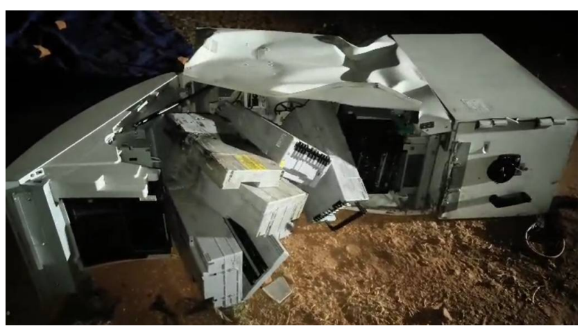
కదిలింనే వార్త ధర్మవరం మే 7

హంపాపురం జాతీయ రహదారి ఎదురుగా పడవేసిన దుండగులు.