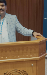
అని తన ఉపన్యాసాన్ని ఆయన ముగిసినట్లు తెలిపారు.

ఈ సమావేశాలలో పాలు పంచుకోవడం జరిగిందన్నారు. ప్రపంచ ప్రజలు శాంతియుతంగా ఉండాలని, దేశ, ప్రపంచ ఆర్థిక వ్యవస్థ అభివృద్ధికి ప్రతి ఒక్కరు కృషి చేయాలని కోరారు. దేశ భాషలందు తెలుగు లెస్స అంటూ, తనకు సదస్సులో పాల్గొనే అలాంటి అదృష్టమైన అవకాశం దొరకడం తన దేశం ఇచ్చిన సువర్ణ అవకాశం అని ఆయన తెలిపారు, తాను పుట్టిన నేలకు, భారత మాతకు, శిరస్సు వంచి పాదాభివందనం చేసి, ఐక్య రాజ్య సమితి భవనంలో రెప రెప లాడే మన దేశ జాతీయ జెండాను ఆవిష్కరించి, తన ప్రసంగాన్ని నిర్వహించడం జరిగిందన్నారు. ఈ ప్రసంగంలో తన తల్లిదండ్రులను గుర్తు చేసుకోవడం జరిగిందన్నారు. జై జవాన్ - జై కిసాన్, జై హింద్ అయిన ముగిసినట్లు తెలిపారు.