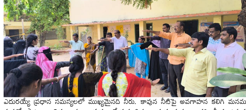
మెరుగయ్యే ప్రధాన సమస్యలో ముఖ్యమైనది నీరు. కావున నీటిపై అవగాహన కలిగి మనము, మనతో పాటు భావితలాలను జాగ్రతం చేయవలసిన బాధ్యత మన అందరి మీద ఉన్నదని తెలియజేశారు. అధ్యాపక బృందం, పంచాయతీ సిబ్బంది, విద్యార్థిని విద్యార్థులు జల సంరక్షణ ప్రతిజ్ఞ చేశారు. జాతీయ గీతంతో కార్యక్రమం ముగించబడినది.