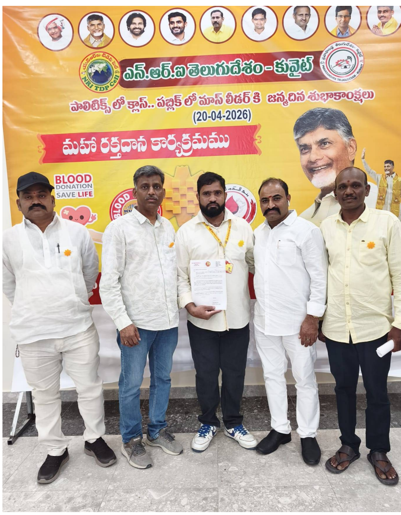
ఎన్.ఆర్.ఐ తెలుగుదేశం - కువైట్ పాలిటిక్స్ లో క్లాస్.. పబ్లిక్ లో మాన్ లీడర్ కి జన్మదిన శుభాకాంక్షలు (20-04-2026) మహా రక్తదాన కార్యక్రమము