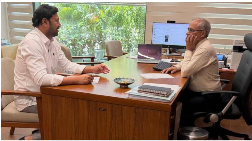
వారిపై కఠిన చర్యలు తీసుకోవాలని మరియు పెరుగుతున్న ఎల్పీజీ ధరల నుండి ప్రజలకు ఉపశమనం కలిగించేలా చర్యవేక్షణ యంత్రాంగాన్ని బలోపేతం చేయాలని ఎంపీ అవినాష్ రెడ్డి కేంద్ర సెక్రటరీని కోరారు. దీనిపై సానుకూలంగా స్పందించిన సెక్రటరీ, తగిన చర్యలు తీసుకుంటామని హామీ ఇచ్చారు