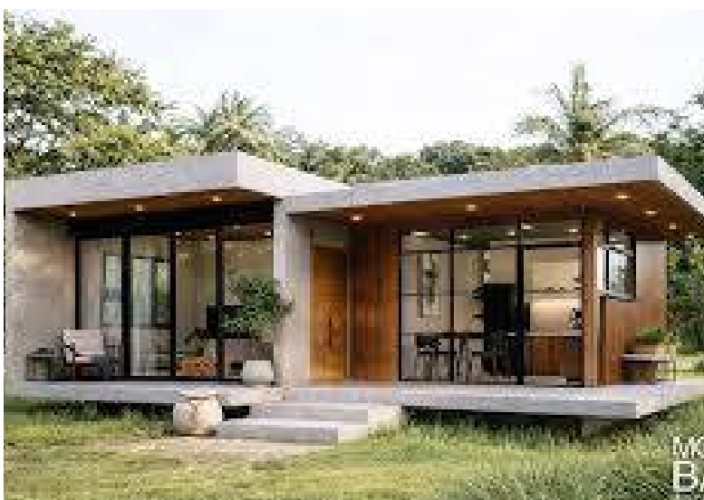
ఇటుకల కంటే ఈ ఇటుకలతో నిర్మాణ సమయం ఆదా మామూలు ఇటుకలతో పోలిస్తే ఈ ఇటుకలతో గోడలు చాలా వేగంగా కట్టవచ్చు. ఖర్చు తగ్గుతుంది. ప్లాస్టరింగ్ సిమెంటు ఖర్చులు తగ్గడం వల్ల మొత్తం నిర్మాణ వ్యయంలో 20% నుండి 30% వరకు ఆదా అయ్యే అవకాశం ఉందంటున్నారు. 10 ఏళ్లలో ఎప్పుడూ లేనిది ఇప్పుడే ఎందుకు

ఇల్లు కట్టాలంటే ఇటుకలు తప్పకుండా ఉపయోగించాలి. అంతే కాదు ఇటుకలకు తోడుగా సిమెంట్, కాంక్రీట్ వాటిని గోడలు కట్టడం కోసం ఎక్కువగా ఉపయోగించాల్సి ఉంటుంది. కాని మారుతున్న కాలానికి అనుగుణంగా టెక్నాలజీని ఉపయోగించి ఖర్చు తక్కువతో ఇల్లు కట్టేందుకు ఇంటర్ లాక్ ఇటుకలు బెస్ట్ ఆప్షన్ గా మారాయి. ఇల్లు కట్టడం అనేది ఇప్పుడు ఒక మంచి ట్రెండ్ అవుతోంది. సాధారణ ఇటుకలతో పోలిస్తే వీటి వల్ల చాలా ఉపయోగాలు ఉన్నాయి. సిమెంటు వాడకం తక్కువ ఈ ఇటుకలు ఒకదానికొకటి లాక్ అయ్యేలా ఉంటాయి కాబట్టి గోడలు కట్టేటప్పుడు వరుసల మధ్య సిమెంటు మిశ్రమం వాడాలి అవసరం ఉండదు. కేవలం పునాది, పిల్లర్లు పైన బీమ్స్ దగ్గర మాత్రమే సిమెంటు వాడతారు. ప్లాస్టరింగ్ అవసరం లేదు ఈ ఇటుకలు చూడటానికి చాలా ఫినిషింగ్ తో ఉంటాయి. కాబట్టి గోడలకు ప్లాస్టరింగ్ చేయకుండానే నేరుగా పెయింట్ వేసుకోవచ్చు. దీనివల్ల ఖర్చు బాగా తగ్గుతుంది. దీనికి సంబంధించి మేస్ట్రీ నాగ్స్ లోకల్ 18తో మరికొన్ని వివరాలు షేర్ చేసుకున్నారు. ఇల్లు కట్టాలంటే ఇటుకలు తప్పకుండా ఉపయోగించాలి. అంతే కాదు ఇటుకలకు తోడుగా సిమెంట్, కాంక్రీట్ వాటిని గోడలు కట్టడం కోసం ఎక్కువగా ఉపయోగించాల్సి ఉంటుంది. కాని మారుతున్న కాలానికి అనుగుణంగా టెక్నాలజీని ఉపయోగించి ఖర్చు తక్కువతో ఇల్లు కట్టేందుకు ఇంటర్ లాక్ ఇటుకలు బెస్ట్ ఆప్షన్ గా మారాయి. ఉమ్మడి అసంతృప్తం జిల్లా కడిరి వాసి నాగ్స్ మాట్లాడుతూ ఈ ఇటుకలు ప్రస్తుతానికి చాలా గట్టిగానే ఉన్నాయని.. వర్షం, ఎండకు అన్నిటికీ తట్టుకునే స్థాయిలో వీటిని తయారు చేస్తున్నట్లుగా వివరించారు. అయితే ఈ ఇంటర్లాక్ ఇటుకల వల్ల మామూలుగా నిర్మించుకునే